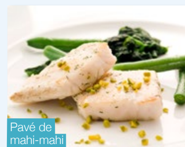
Pavé de mahi-mahi