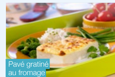
Pavé gratiné au fromage