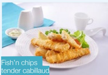
Fish'n chips tender cabillaud