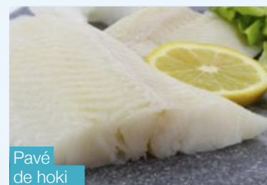
Pavé de hoki