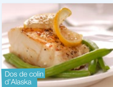
Dos de colin d'Alaska