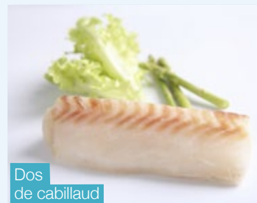
Dos de cabillaud