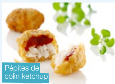
Pépites de colin ketchup